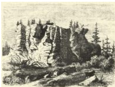
A Csík-csicsói vár sziklahegyének déloldali látképe. (Rajz. Greguss János.)

Melléklem egyszersmind a vár szikla hegyének déloldali felvett képét is.